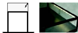
Eclairage LED fixés sur la partie haute du profilé, à l'avant et/ou à l'arrière.