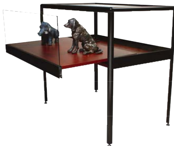
Vitrine table Prestige à tiroir coulissant

Dimensions : H 92 x L 103 cm. Profondeur : 60 ou 100 cm. Hauteur de présentation : 30 cm.